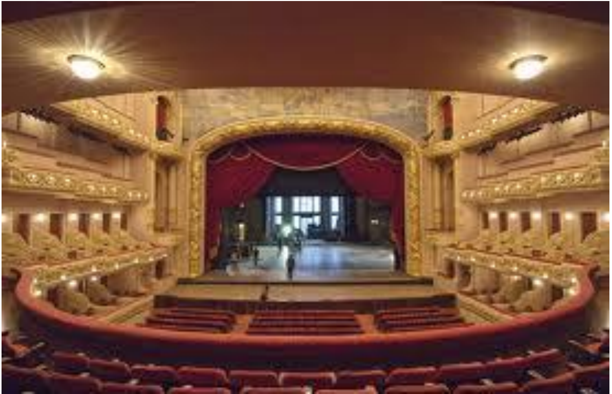
Fakkii 2: Waltajjii Amanamaa (Thrust Stage)

Waltajjii sadaffaafi isa areenaa (arena stage) jedhamu keessatti immoo jamaan bakka agarsiisaa marsanii taa'u. Karaan seensaafi ba'iinsaa jamaa kana gidduun hafu. Diraamaan tokko waltajjii yeroofi bakka murtaa'aa seenaa diraamichaaf mijatu irratti akka dhihaatu jamaanis ta'e namoonni waltajjii kan mijeessan (stage personnel) nibeeku. Barreessaanis diraamicha yeroo barreessu kana yaadaatti qabatee barreessa. Waltajjiin areenaammoo kanneen kanaa gaditti dhihaatan fakkaata.