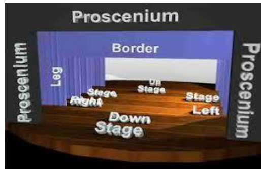
Fakkii1: Waltajjii Proscenium ( Proscenium Stage )

Waltajjiin ammayyaa inni lammaffaan waltajjii amanamaa (thrust stage) jedhamuun beekama. Waltajjii kana keessatti jamaan bakka agarsiisaa (acting area) keessaa harka sadii arfaffaatti naanna'anii taa'u. Gochaaleen hundi bakkuma kanatti kan agarsiifaman yoo ta'u, muraasni isaanii immoo roga isa arfaffaarratti ce'anii dhihaachuu danda'u. Waltajjiin amanamaan kan armaan gaditti dhihaate fakkaata.